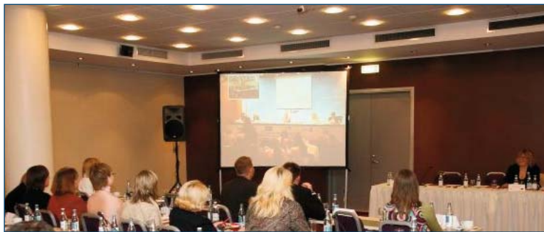
Conferencia Duplex en vivo entre Palma de Mallorca y Riga 29 de Septiembre de 2006. Riga (Letonia)