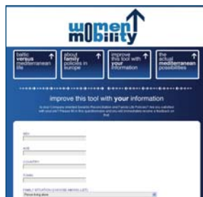
Página web: Women Mobility

ser tomadas en consideración cuando se decide mudarse a otro estado miembro por motivos laborales. También es importante distinguir las diferencias en las estructuras familiares (familia uni-