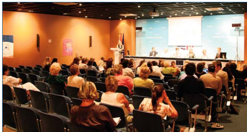
Conferencia Duplex en vivo entre Palma de Mallorca y Riga el 29 de Septiembre de 2006. Palma de Mallorca

El impacto en el largo plazo que el proyecto pretende tener es el de aumentar la concienciación de trabajadores y empleadores (organizaciones de mujeres empresarias) sobre los derechos de los trabajadores y sobre como los derechos los sistemas de Seguridad Social pueden afectar decisiones sobre movilidad al estar relacionadas con la reconciliación de la vida laboral y familiar. Esto puede promover debates mejor fundados, a la par que los estados miembros avanzan con las reformas de los beneficios de la Seguridad Social (en el contexto de los Programas Nacionales de Re-