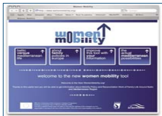
Women Mobility web page

Although MISSOC already offers comparative table in PDF format with 4 countries ( http://europa.eu.int/comm/employment_social/social_protection/missoc_tables_en.htm#2005 ), what AFAEMME did was to allow that the information between two MS could be consulted in a interactive manner by selecting the issue one was more interested in (for example: family benefits, unemployment, health care, etc.). EURES also has a database that allows workers to extract information on different aspects in each Member State, but it does not allow a direct comparison ( http://europa.eu.int/eures/main.jsp?acro=lw&lang=en&catId=490&parentId=0 ). Thus, AFAEMME's tool adds value and sheds a new light to the existing databases and tools in use on Commission web-pages.