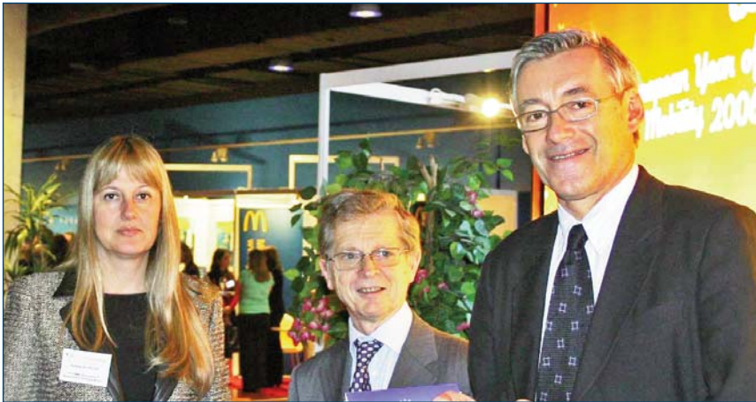
"European Year of Workers' Mobility Closing Conference" at Lille (France), 11 th and 12 th December 2006.

The partners also attended the "European Year of Workers' Mobility Closing Conference" that took place in Lille on December 11th and 12th 2006. The event counted with an exposition of 13 stands where Associations and European Organizations presented the projects they had developed during the year 2006. Among the expositors were AFAEMME and the Coalition for Gender Equality of Latvia, who had the opportunity to present the web portal and the interactive tool developed during one of the workshops organized in the event.