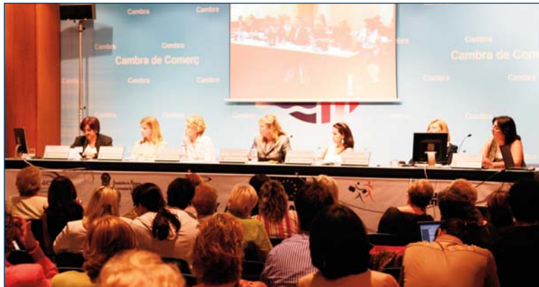
Conferencia Duplex en vivo entre Palma de Mallorca y Riga 29 de Septiembre de 2006. Palma de Mallorca

El 29 de septiembre de 2006 se realizó una videoconferencia entre Palma de Mallorca y Riga organizada por AFAEMME, ASEME Baleares (Asociación de Mujeres Empresarias de Baleares) y la Coalición para la Igualdad de Género de Letonia, con el propósito de lanzar el portal de movilidad ( www.womenmobility.org ) que contenía la herramienta desarrollada. El encuentro tuvo lugar dentro del marco del Día Europeo de la Movilidad de los Trabajadores.