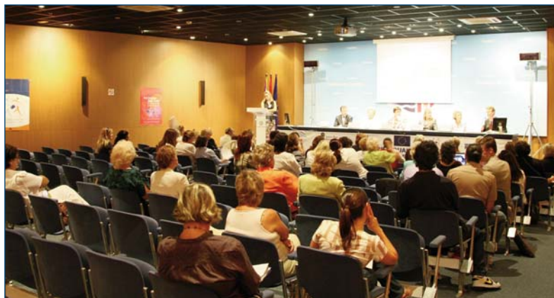
Duplex live meeting between Palma de Mallorca and Riga, 29 th September 2006. Palma de Mallorca (Spain)

yers (businesswomen organizations), of workers' rights as well as how social security rights can affect mobility decisions as they relate to the reconciliation of work and family life. This can promote better founded debates, as MS move forward with their social security benefits reforms (in the context of the National Reform Programmes), and can also contribute to the debate about the legislative initiatives planned in the area of freedom of movement in the EU.