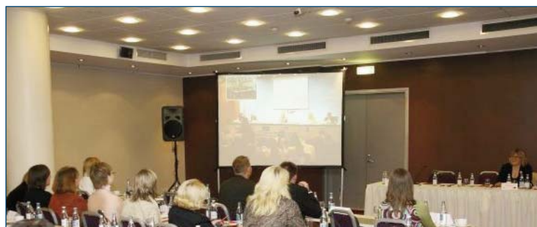
Duplex live meeting between Palma de Mallorca and Riga, 29 th September 2006. Riga [Latvia]