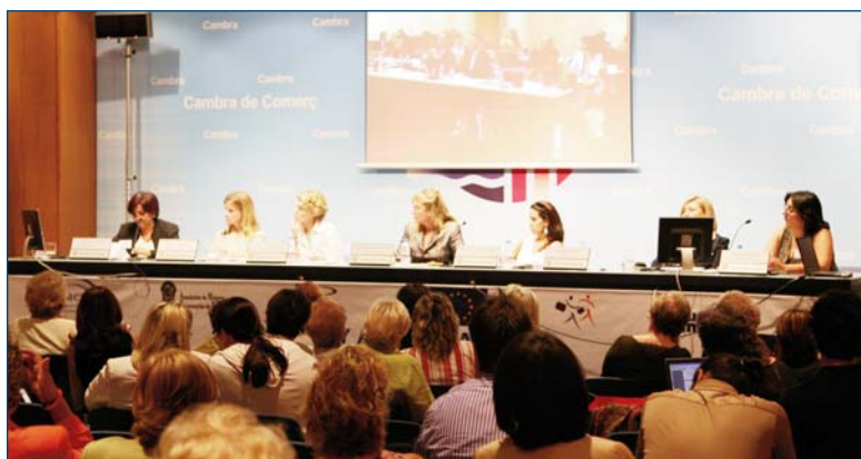
Duplex live meeting between Palma de Mallorca and Riga, 29 th September 2006. Palma de Mallorca [Spain]

On September 29th, a videoconference between Mallorca and Riga was organized by AFAEMME, ASEME Balears (Association of Businesswomen from Balearic Islands) and the Coalition for Gender Equality of Latvia, for the launching of the developed tool in the Web portal www.womenmobility.org . The meeting took place within the framework of the European Day for Workers' Mobility.