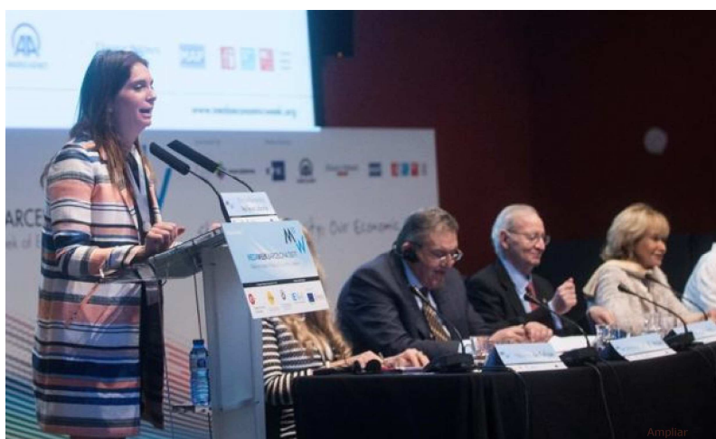
La presidenta del Banco Europeo de Reconstrucción y Desarrollo en Marruecos, Marie-Alexandra Veilleux-Laborie, interviene en la tercera y última jornada de Semana Mediterránea de Líderes Económicos (MedaWeek) que cierra su programa con sesiones dedicadas a los flujos migratorios y a las mujeres emprendedoras.

Barcelona, 24 nov (EFE).- Una amplia representación de mujeres empresarias y emprendedoras de países del Mediterráneo han reivindicado hoy en Barcelona un mayor protagonismo en la economía de la región.