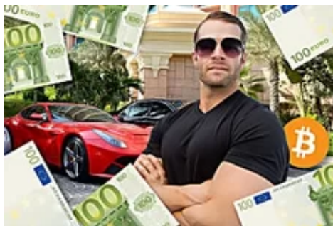
Un hombre compra 27 € de bitcoin, se olvida de ellos, ahora descubre que valen 886 mil € (es.investingdaily.me)