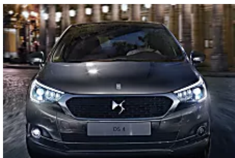
Disfrute de los viernes negros en DS (dsautomobiles.es)