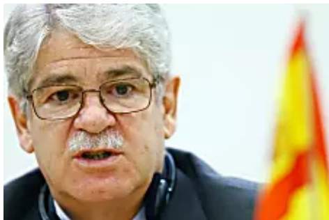
El Gobierno abre la puerta a un referéndum nacional para aprobar una consulta legal en Cataluña