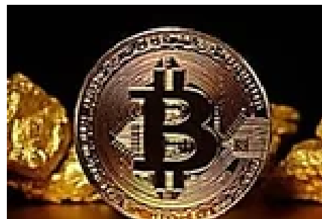
¿ Porque todo el mundo invierte en Bitcoins? Aqui la verdad (24businessreportes)