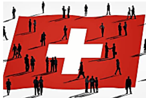
Suiza necesita trabajadores de forma urgente: su mercado laboral ya está 'seco'