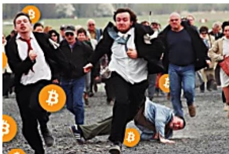
La razón por la que los españoles están comprando Bitcoins. (24businessreportes)