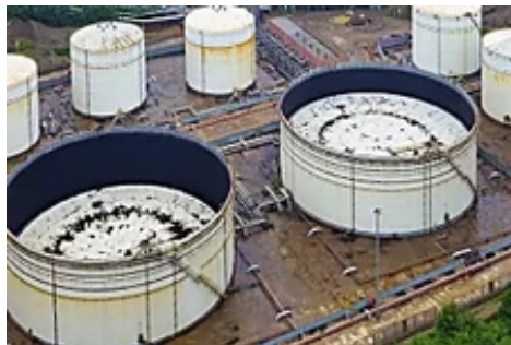
El petróleo 'secreto' de Arabia Saudí podría quedar al descubierto por satélites